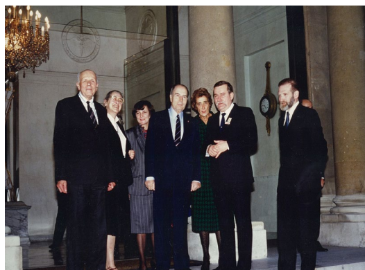
Zdjęcie zrobione z okazji 40. rocznicy Powszechnej Deklaracji Praw Człowieka, Paryż, grudzień 1988 r.