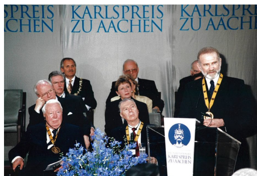
Nagroda Karola Wielkiego, Akwizgran